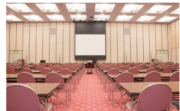
図1 計算対象施設例 神商ホール

そこで、神戸商工会議所は施設形状など建築設計分野および、建物内の気流や空気質分野の専門家、システムコンサルタントの方々の協力の下、大学の学生や解析企業などとプロジェクトチームを組んで令和2年5月より『KCCI神戸換気シミュレーション・プロジェクト』事業をスタートしました。