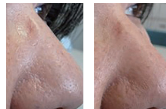
図3 試作品での検証結果 (左:初期形状、右:改良後)

今後も掛け心地の良い眼鏡フレームの開発にシミュレーションを利用していく予定です。