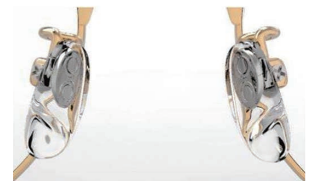
図4 製品化した鼻パッド