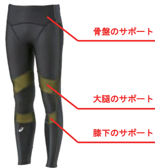
図1 ランニングタイツ(ロングタイツ RF)

アパレル製品は各社の規格に準じた標準体型に合わせて設計されます。しかしながら、着用者の体型は千差万別であるため、標準体型とは異なる着用者にとって、十分な効果が得られない、着心地を損ねるといったことが懸念されます。そこで、個々の体型に合わせたランニングタイツのカスタム設計を試みました。