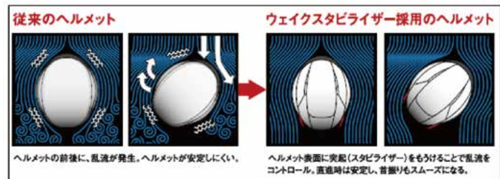
図2 空力デバイス「ウェイクスタビライザー」の効果

図1は、ウェイクスタビライザーの有無による空力解析結果の比較です。右は風がスムーズに流れているのが分かります。図2はウェイクスタビライザーの効果のイメージ図です。丸い場合は、ヘルメットの直後に乱流が発生して頭部が安定しにくいですが、突起を設けることで、乱流がヘルメットの直後に発生せず、直進時はブレずに安定し、首もまるでスピードが出ていないような感覚でスムーズに動かせるようになります。