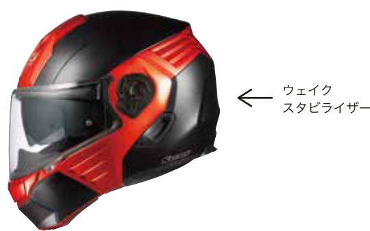
写真1 オートバイ用ヘルメット (KAZAMI)

そこで、大学の研究者と共同で社内にある実験設備を使い、モックアップを作っては修正しながらの風洞実験、空力解析を繰り返し行ってきました。風洞実験は気温による空気密度の変動、また装着時の微妙なずれによりデータにはどうしてもばらつきがでます。また、モックアップは短時間で繰り返し製作できるものではなく、開発に数年の単位が掛かっていたこともあり、効率的な手法が望まれていました。