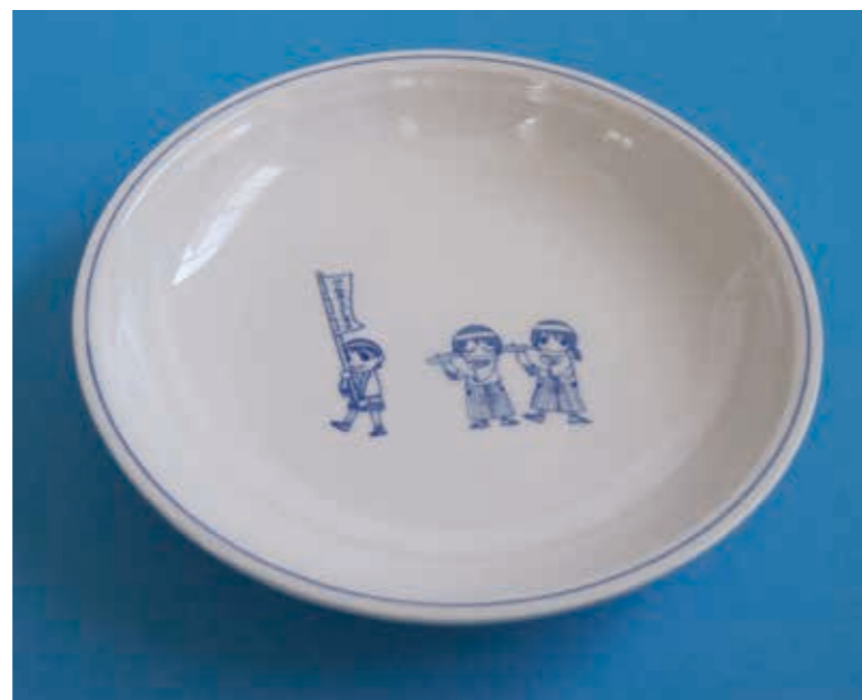
写真1. 「三川内焼」による学校給食用食器

学校給食用の食器には、これまでプラスチック製や金属製の食器が用いられてきましたが、食育の観点から、さらに地元の伝統工芸品でもあるアルミナ強化磁器「三川内焼」の普及の観点から、磁器食器を学校給食に用いることを検討してきました。しかし、これまでは食器洗浄機での処理時や運搬時等の衝撃により、食器の縁の部分に欠けが発生することがあり、安全上問題になっていました。