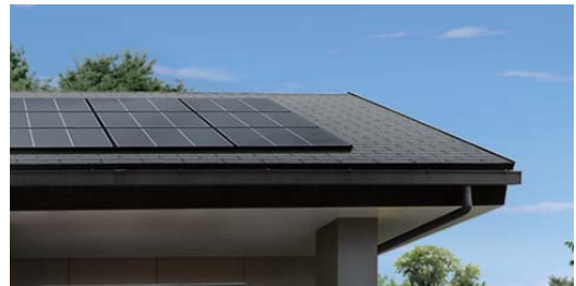
写真1. CIS 系化合物半導体太陽電池

地球シミュレータにより第一原理計算コードを用いて、CIS(CuInSe) 系の化合物半導体太陽電池において、結晶欠陥をつくる傾向が高い元素と、結晶中の欠陥サイトの同定を行いました。