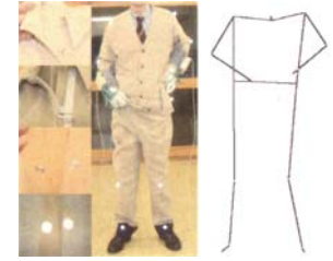
図1. 着脱動作と握み力の測定

高齢者や障害者の指先の握み力を測定して無理なく使えるマグネットの吸着力を設定した上で、磁気回路シミュレーションを行って、ボタンの構造を検討しました。設計にあたっては、ボタンを小型・軽量化するために、NdFeB 磁石を採用し、さらにデザイン性、量産対応のため既存のミシンで縫えること、磁力によりミシンボビンに吸着したりしないこと、漏れ磁界によるペースメーカーや磁気カード等への影響防止などの課題を克服しました。