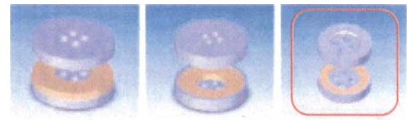
図2. マグネット式ボタンのデザイン検討