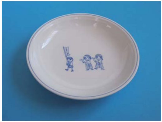
写真1. 「三川内焼」による学校給食用食器

学校給食用の食器には、これまでプラスチック製や金属製の食器が用いられてきましたが、食育の観点から、さらに地元の伝統工芸品でもあるアルミナ強化磁器「三川内焼」の普及の観点から、磁器食器を学校給食に用いることを検討してきました。しかし、これまでは食器洗浄機での処理時や運搬時等の衝撃により、食器の縁の部分に欠けが発生することがあり、安全上問題になっていました。