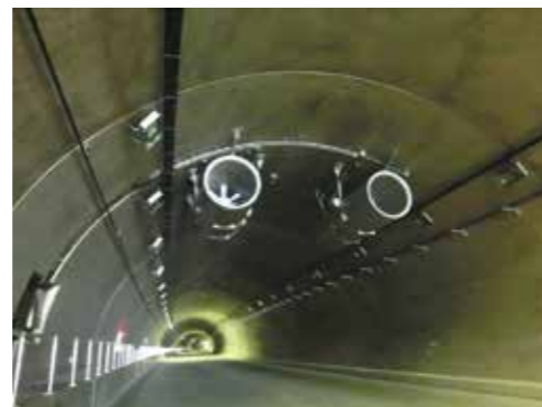
図1 換気機(ジェットファン)

トンネル内における自動車の追突事故などが原因で火災が発生すれば有害で高温のガス(煙、CO、CO 2 、HCN)が発生しドライバーの生命に影響するので、こうしたガスの温度分布、濃度分布について米国国立標準技術研究所で開発された火災現象の3次元シミュレーションソフトウェアFDS(Fire Dynamics