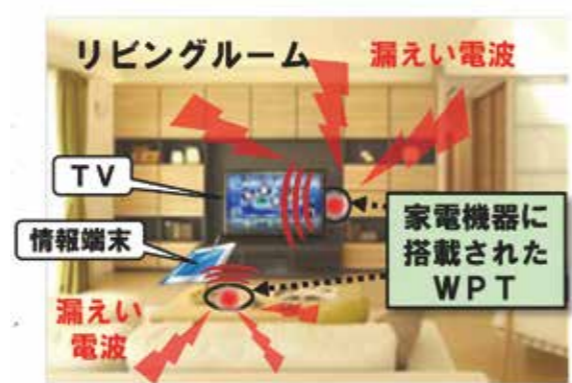
図1 家庭用電子機器向けWPTシステム

家庭用電子機器や電気自動車の充電に用いられるワイヤレス電力伝送 (WPT: Wireless Power Transfer) システム (図1) から漏えいする電磁界は他の電子機器の誤作動原因になり得るため、様々な設置環境を考慮した定量的な影響評価が必要不可欠となります。 例えば、住宅環境においてはラジオ受信機や携帯端末、無線 LAN ルータなどの無線機器が存在します。また、住宅や商業施設では電気自動車充電用の WPT システムが複数配置されるケースも想定され、近隣住宅へ与える影響を把握する必要があります。しかし、戸建て住宅や商業施設全体の漏えい電波を測定機器で測るには多大な時間と労力がかかるので、シミュレーションによる解析が望ましく、大規模計算になるのでスーパーコンピュータの利用が有効となります。そこで、これらの環境下における WPT システムからの漏えい電波の特性を解析し、測定結果と比較することで解析モデルの妥当性の検証を行い、複数の WPT が同時動作する場合の漏えい電波の特性の解析などを行うことにしました。