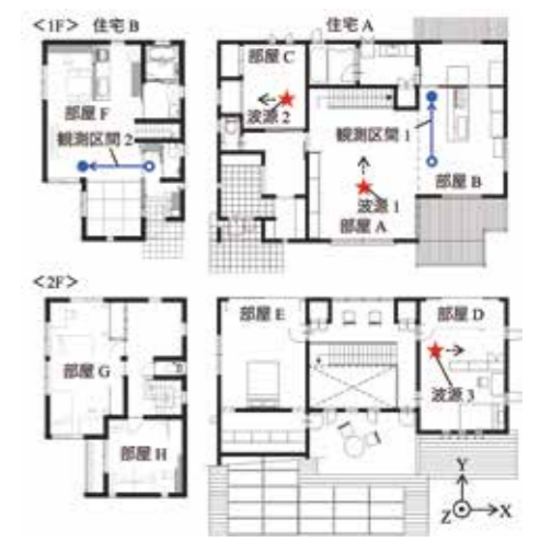
図3 波源の配置及び観測区間の位置

各部屋のWPTシステムが同時動作するケースを想定し、波源を住宅Aの3カ所(部屋A、部屋Cおよび部屋D)に1個ずつ配置し、送信電力は各波源それぞれ10dBmとしました。また、漏えい電波の観測区間は住宅Aの部屋Bの区間1と、隣家住宅Bの部屋Fの区間2を選定しました。