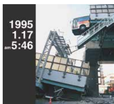
写真1 兵庫県南部地震による阪神高速道路の被害

このため、大規模な地震応答シミュレーションを有効なソリューションとして位置づけ、2014年より、「京」を用いた基礎研究として、延長30kmの連続高架橋を対象とした解析や、1995年兵庫県南部地震で被害を受けた東神戸大橋の損傷過程の再現解析を実施してきています。