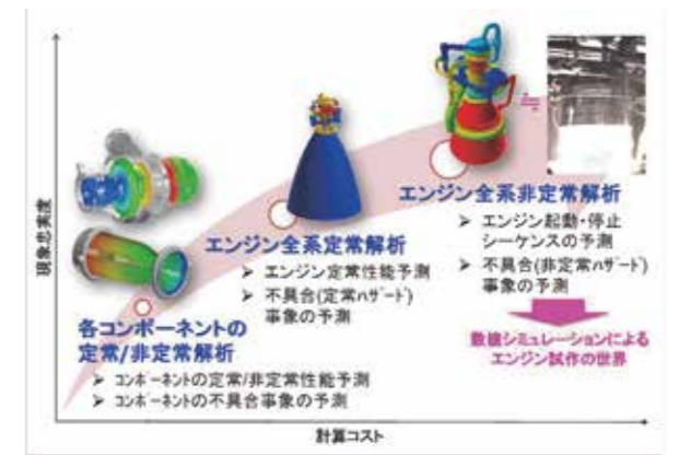
図4 エンジンシミュレーションの将来

ここで培った技術や独自開発したソフトウェアを産業界でも活用・展開して行くことを検討しています。