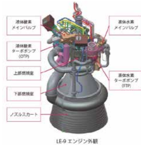
図1 新型基幹ロケットH3とその1段エンジンLE-9

H3ロケット開発に先立ち、JAXAではLE-9エンジンの技術的成立性確認、また高信頼性開発プロセスの構築とそれに必要な数値シミュレーション技術の開発を目的として、2005年からLE-Xエンジンの研究を進めてきました。それに関連して、本稿では液体ロケットエンジン開発の最重要コンポーネントである燃焼器を対象に、その冷却特性を定量的に予測可能とするために構築した数値シミュレーション技術をご紹介します。