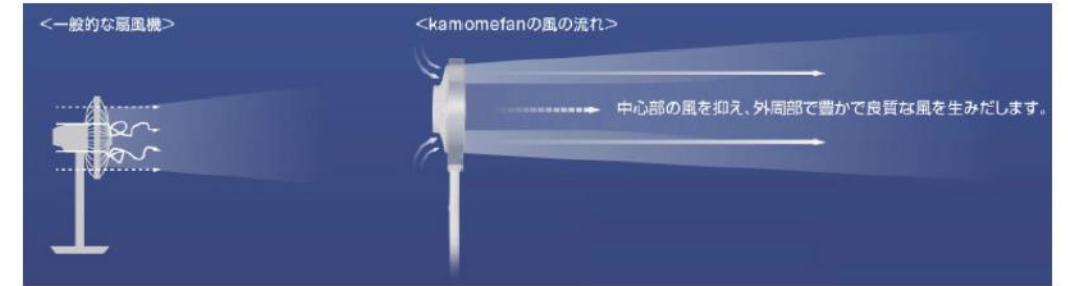
図2. カモメをヒントにした風に対する開発方針

これらを解決するために流体解析(CFD, Computational Fluid Dynamics)や音響計測(Acoustic Measurement)技術を活用することにしました。基本的なアイデアとして、羽ばたく動きが少なくても遠くまで移動できるカモメをヒントにし、気流の流れや騒音の原因となる中心部の風を抑え、外周部で豊かで良質な風を生み出す、新しい形状の羽根を開発するという方針を決めました。