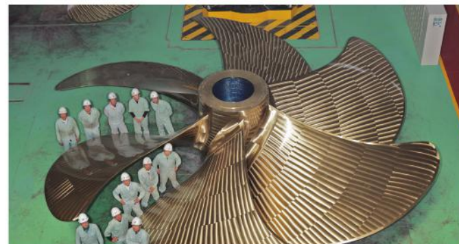
図1. 船舶用大型プロペラ

これらを解決するために流体解析(CFD, Computational Fluid Dynamics)や音響計測(Acoustic Measurement)技術を活用することにしました。基本的なアイデアとして、羽ばたく動きが少なくても遠くまで移動できるカモメをヒントにし、気流の流れや騒音の原因となる中心部の風を抑え、外周部で豊かで良質な風を生み出す、新しい形状の羽根を開発するという方針を決めました。