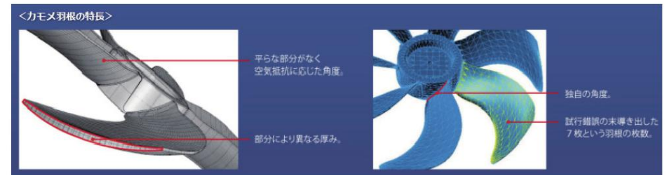
図3. カモメ羽根の解析モデル画像

負荷を極力抑えて効率的に羽を動かし大陸間を移動するカモメの羽をイメージして作られたのが図3の「カモメ羽根」です。こうした条件のもと、解析技術を駆使しながら設計された新しいファンは、風量は増しながらも、DC(直流)モーターを採用することで消費電力は最大約92%の低減効果を実現できました。