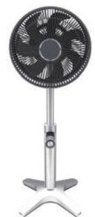
図5. カモメファン(新製品)