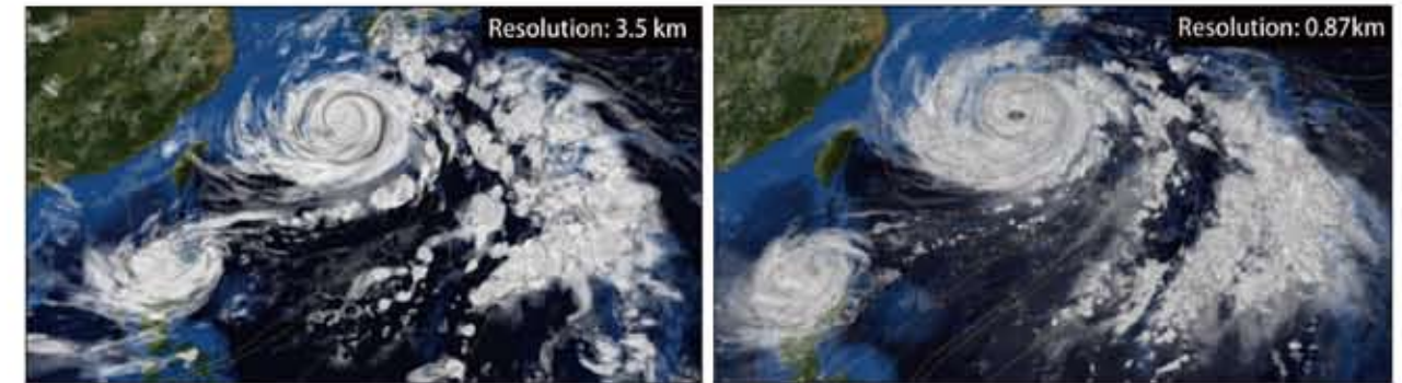
図1. 解像度の差によるシミュレート比較

図1は従来の最高解像度(水平格子間隔3.5 km)で行った台風の状態予測シミュレーション結果(左)と「京」を用いて1 km未満の格子間隔で予測をした結果(右)の比較です。詳細な雲などの大気の状態予測が可能になっているのがわかります。