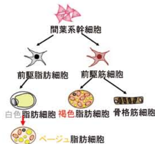
図1. 脂肪細胞の分化過程

興味深いことに、継続的な寒冷刺激を受けると、ある部位(主に皮下脂肪と呼ばれる部位)の白色脂肪細胞ではミトコンドリアが増えて褐色脂肪細胞に似た色となり熱産