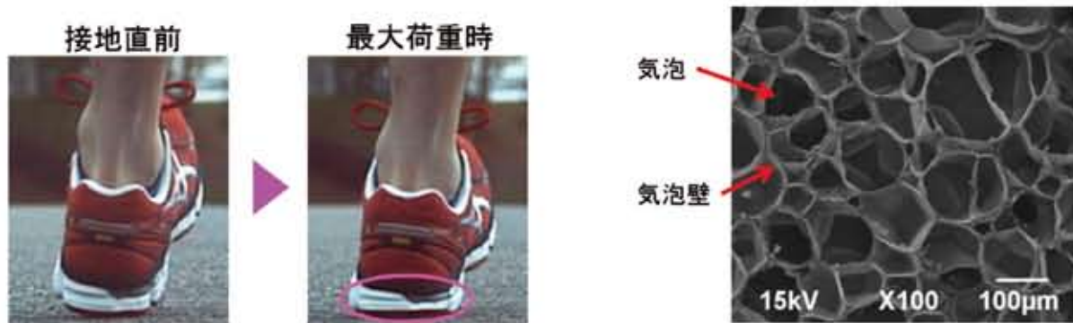
図1. ランニング中のソールの変形状態

そこで、樹脂フォーム材に圧縮力が作用した際の力学的挙動を解析できるモデルを作成し、シミュレーションを用いてクッション性に影響を及ぼす因子について考察しました。