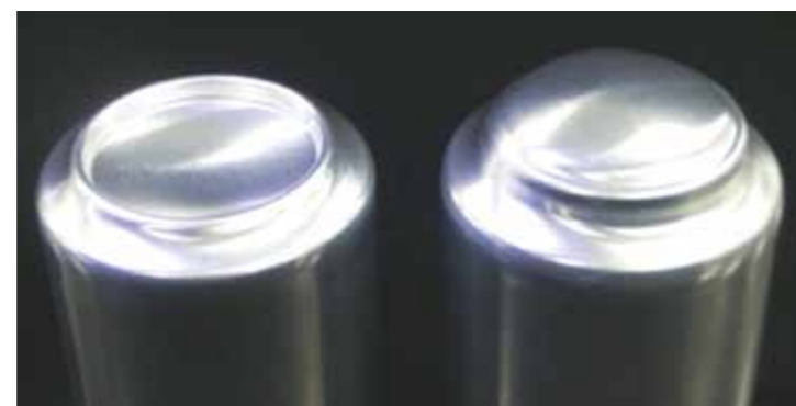
図1. 通常の缶底(左)とバックリングした缶底(右)

そこで、軽くて丈夫なアルミ缶の形状を精度良く効率的に探索するためには、試作品を作製せずにシミュレーションを用いて、スピーディーに耐圧値を予測しつつ適切な形状を求める技術開発が必要でした。