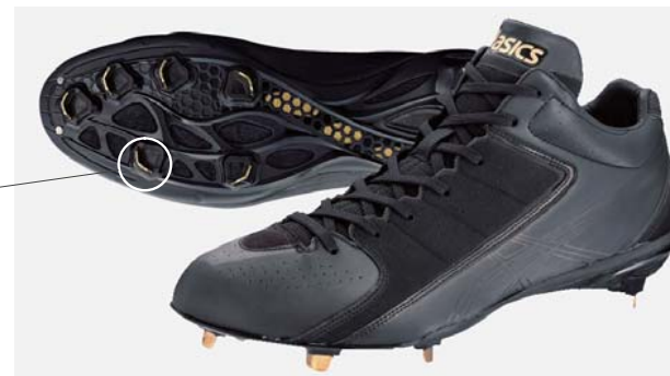
図5. 軽量野球スパイクシューズ