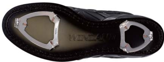
図1. 革底野球スパイク金具

野球スパイクは、これまで、図1に示すような革製の靴底の踵部と踏み付け部に3本の歯を持つ金具を取り付けたものが一般的でした。さらに、十数年前には、より高いグリップ性を実現するために、3本以上の歯を有した様々な形状の金具も提案されています。このような金具は、歯が摩耗した場合には、金具のみを交換することができるといった利点があるのに対して、靴底に取り付けるためのベース部分が必要とされ、野球スパイク全体の設計に対する自由度が小さいなどの欠点があります。