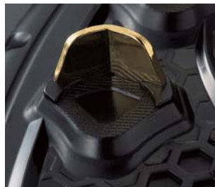
図2. 樹脂埋め込み式スパイク金具

近年では、歯の方向、歯の配置など野球スパイクにおける設計自由度の向上させるために、図2に示すように樹脂製の靴底に金具を直接埋め込んだ靴底が提案されています。このような樹脂製の野球スパイクの設計においては、グリップ性に加え、安定性、軽量性を考慮した設計が重要となります。