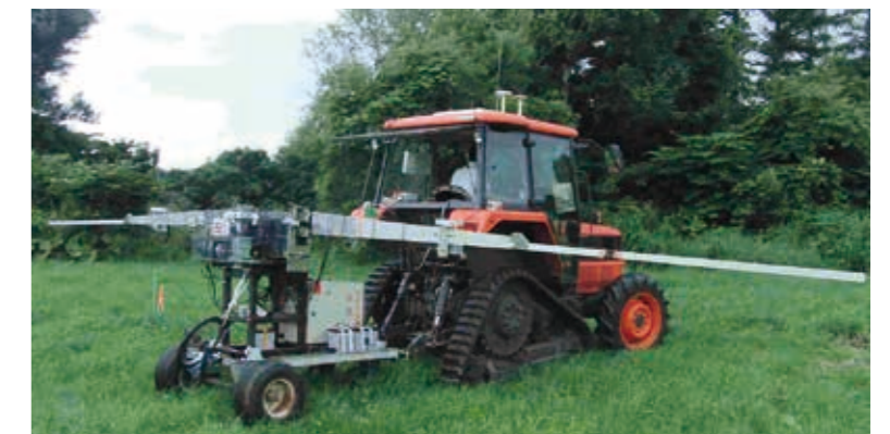
図3. 農薬散布機試作機