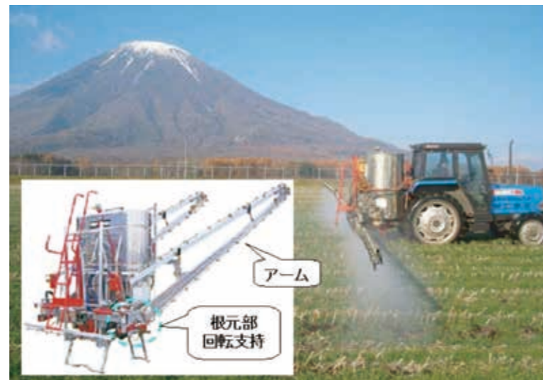
図1. 農薬散布機作業アーム