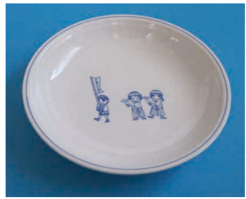
写真1. 「三川内焼」による学校給食用食器

学校給食用の食器には、これまでプラスチック製や金属製の食器が用いられてきましたが、食育の観点から、さらに地元の伝統工芸品でもあるアルミナ強化磁器「三川内焼」の普及の観点から、磁器食器を学校給食に用いることを検討してきました。しかし、これまでは食器洗浄機での処理時や運搬時等の衝撃により、食器の縁の部分に欠けが発生することがあり、安全上問題になっていました。